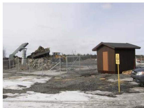
Рис.4 Временка с датчиком. На фоне самосвал возле загрузочного канала