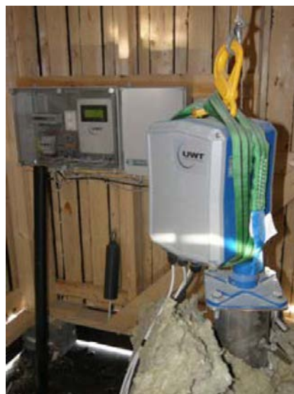
Рис.2 Место установки уровнемера

Стенки заполняемой полости и загрузочного канала подвержены сильному воздействию при засыпании породы, в результате чего возникает дополнительная опасность их осыпания. Поэтому, установить измерительный прибор в загрузочном канале или непосредственно в заполняемой полости невозможно. Для проведения измерений к полости был пробурен вертикальный измерительный канал. Над ним поставили временку, в которой установили Nivobob 3200 (см. Рис.2).